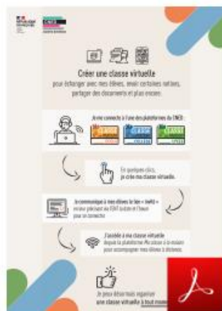
02Doc prof CNED - Créer une classe virtuelle

https://dane.ac-lyon.fr/spip/IMG/pdf/plateforme_cned_v2.pdf