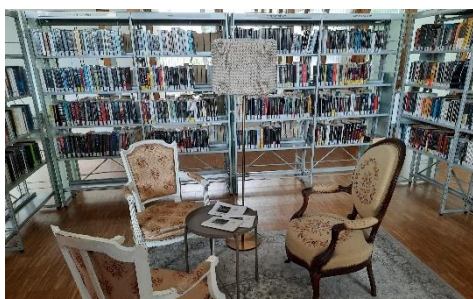
Salon cosy au milieu des romans policiers

Offre scolaire avec minima une visite scolaire. On est vraiment dans une optique de développer l'offre avec les collèges et lycées en proposant un catalogue et en ayant une offre structurée. Actuellement, nous avons un gros partenariat avec les UPE2A, que nous accueillons tous les mois. Il s'agit d'être complémentaire avec les CDI. On s'est aussi rendu compte de la situation géographique de la médiathèque qui est au centre de la fracture sociale (deux quartiers avec des CSP opposés entre celui du quartier Monplaisir avec l'avenue des frères Lumière celui du Bachut avec l'avenue des Etats Unis et Mermoz).