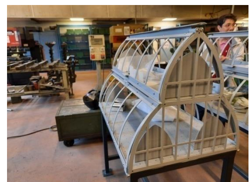
Boîtes à livres commandées par la mairie du 6ème

Cette année l'école a 104 ans et s'inscrit dans des parcours lors des Journées Européennes du Patrimoine. Le lycée propose des formations dans 7 métiers en tension dans les 2 grandes familles : l'industrie et le bâtiment, le tout sur 33 000 m 2 . Il accueille au total 1150 élèves dont 350 nouveaux qui sont tous reçus par Olivia Laborde. La spécificité à la Mache c'est l'indétermination de la filière lors des 4 premières semaines de 2 nde . Cela permet à l'élèves d'expérimenter les ateliers et les filières avant de faire son choix définitif en octobre. Aux ateliers, les élèves travaillent sur