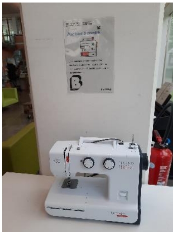
Machine à coudre en libre accès dans l'espace DIY

y avait une toute petite bibliothèque + bibliobus. Aucun travaux n'avaient été faits mis à part l'automatisation des prêts et des retours.